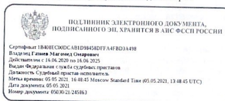
Газиев Магомед Омарович

Вид документа: О_IP_RES_REOPEN, Идентификатор: 82301165586382 Идентификатор ИП: 82301164927605 СПИ, ведущий ИП Газиев Магомед Омарович Формат: http://www.fssprus.ru/namespace/order/2017/2